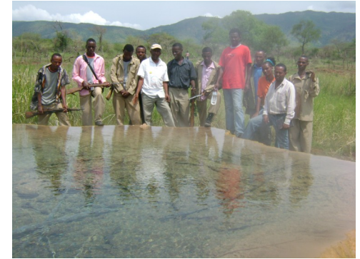
Bilbo Hot Spring

Bilbo/Halo Hot Spring: is situated at the upper parts of Maze River in the park It is a form of geyser, which shoot up hot water from deep in side the ground. The smoke released from this hot spring, cover wide area and seen from a distance. People from far areas and local people used it as traditional medicine.