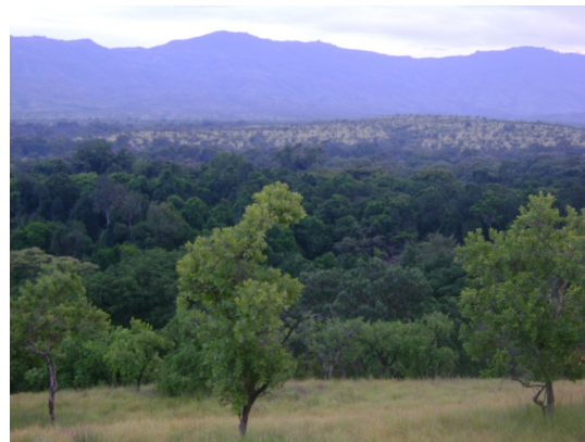
Landscape of Maze

Landscapes: MzNP is surrounded by interesting high rugged mountain ranges, escarpment and small hills. The landscape is breathtaking and potential for eco-tourism development.